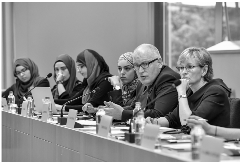
Timmermans in gesprek met jonge moslims in Brussel, 2018.

blijft 'recht te zetten'. Niet voor niets vond de aanval van 2001 op New York plaats op 11 september: de datum dat de Pools koning Jan Sobieski Wenen ontzette, de moslims verjoeg en daarmee Europa redde.